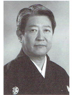
富山清琴 (人間国宝)